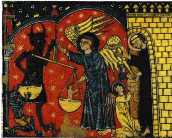
Bilder: katalanisch, Ende des 13. Jahrhunderts

Anmeldung möglichst bis zum 24. September an: