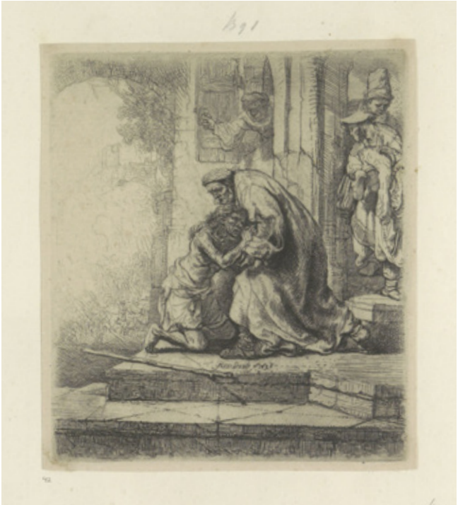
Abbildung: Rembrandt Harmenszoon van Rijn (1606-1669): Rückkehr des verlorenen Sohns